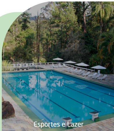
Esportes e Lazer

Localizado em uma área privilegiada de 164 hectares, em plena Serra da Cantareira, o Hotel Fazenda APM é um dos principais benefícios oferecidos aos associados da Associação Paulista de Medicina e Regionais. Cercado por muita área verde, o espaço reúne tranquilidade, infraestrutura completa e diversas opções de lazer para famílias, grupos e eventos.