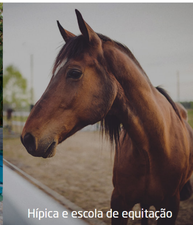
Hípica e escola de equitação